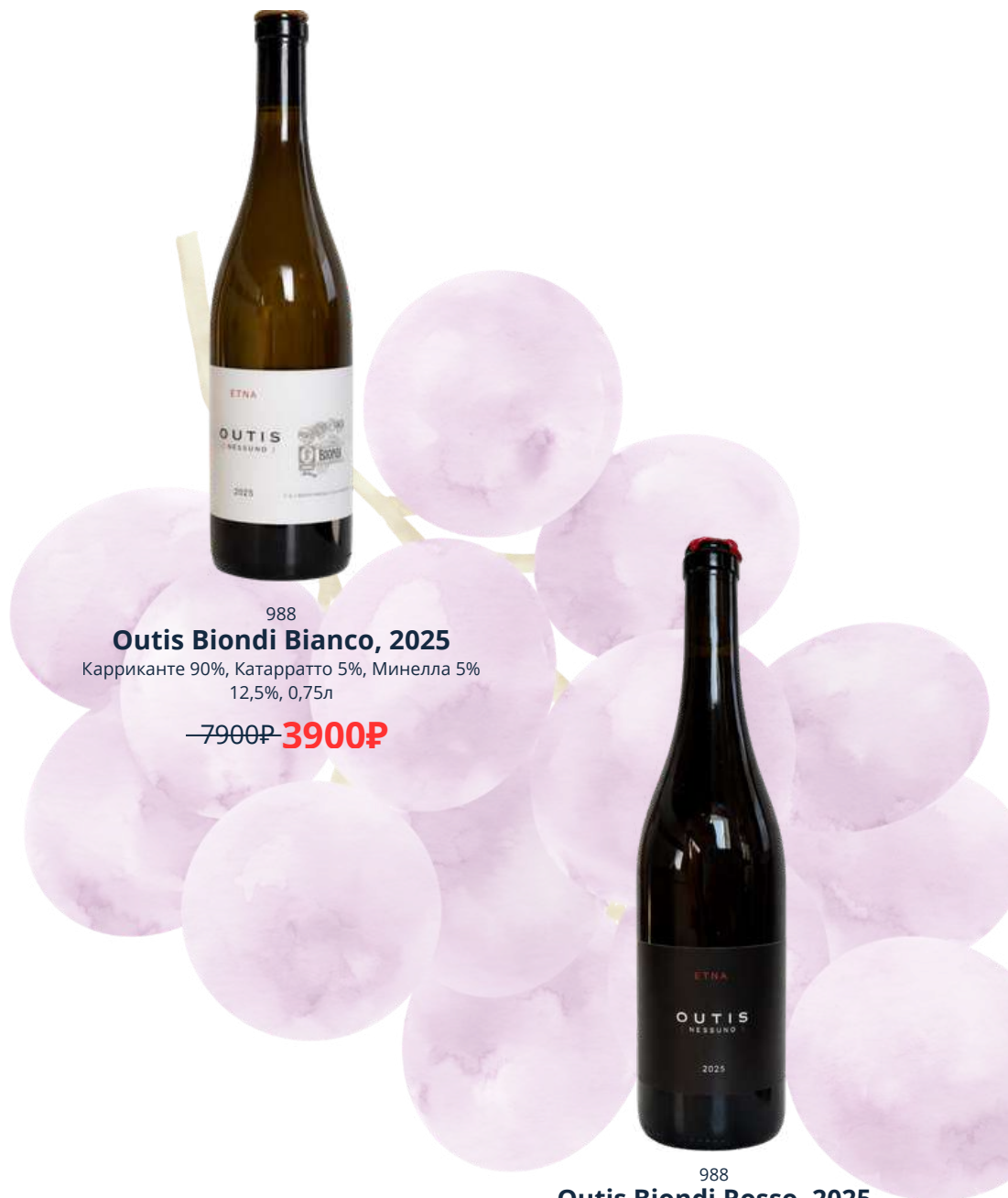
988 Outis Biondi Bianco, 2025 Карриканте 90%, Катарратто 5%, Минелла 5% 12,5%, 0,75л