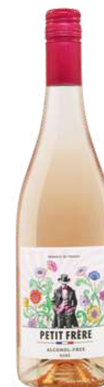
878 Petit Frère Rosé Мерло 100% 0,75л