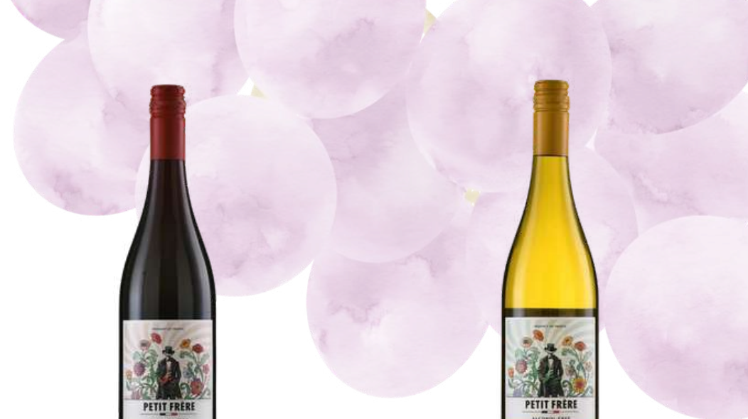
872 Petit Frère Merlot Мерло 100% 0,75л